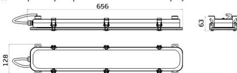
Рисунок 1 Светильник «L-sub 25»

1.5 Общий вид и габаритные размеры светильника показаны на рисунке 1.